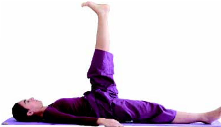
Méridien de la Vessie

jambes pour contrôler le lent retour à la position allongée et restez quelques minutes à vous écouter, décontracté.